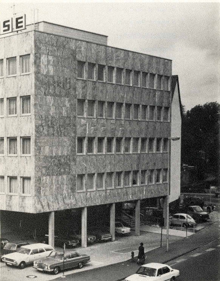
Hersfeld von der Reichstraße aus gesehen.