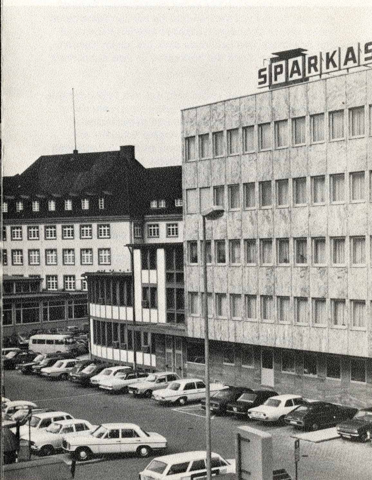
Um- und Erweiterungsbau der Kreis- und Stadtparkasse Bielefeld